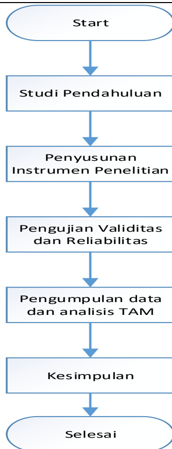
Gambar 1. Kerangka Kerja Penelitian

Kerangka kerja penelitian digunakan untuk melihat variable penelitian dalam adopsi sistem informasi akademik. Variable penelitian yang digunakan adalah indicator pada model TAM. Kerangka kerja ini dengan langkah-langkah berikut: