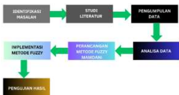
Gambar 1. Diagram Alur Penelitian

Metode Sistem Pakar yang digunakan dalam penelitian ini adalah metode Fuzzy Mamdani . Penelitian yang dilakukan menggunakan tools Matlab yang dapat digunakan dalam mengidentifikasi kepribadian siswa. Penelitian ini terdiri dari beberapa kerangka kerja lur proses yang terdiri dari beberapa tahapan untuk menerapkan metode fuzzy , khususnya metode Mamdani . Tahapan pertama adalah Identifikasi Masalah yang diikuti dengan Studi Literatur untuk memahami konsep yang relevan. Setelah itu, dilakukan Pengumpulan Data dan Analisa Data, yang kemudian dilanjutkan dengan Perancangan Metode Fuzzy Mamdani . Tahapan terakhir melibatkan Implementasi Metode Fuzzy dan Pengujian Hasil untuk mengevaluasi keefektifan dari metode yang diterapkan yang dapat dilihat pada Gambar 1.