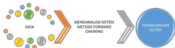
Gambar 3 Bagan Alur Analisa dan Perancangan

Perancangan sistem pakar, analisa memiliki peran yang penting dalam membuat rincian sistem baru. Analisa perangkat lunak merupakan langkah pemahaman persoalan sebelum mengambil keputusan penyelesaian hasil utama, sedangkan tahap perancangan merupakan sistem hasil dari analisa menjadi perancangan agar dimengerti oleh pengguna. Tahapan analisa dan perancangan dilakukan untuk memudahkan dalam mempelajari cara mengetahui deteksi dini berisiko stunting dengan menggunakan metode Forward Chaining . Alur tahapan analisa dan perancangan dapat dilihat pada Gambar 3.